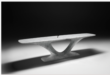
ZHA,Branch Console for Neutra

而另一件Branch Console餐桌則在輕盈和堅固之間取得了微妙的平衡，看起來既懸浮在空間中，又被自然力量所牢牢地扎根，同樣由單一塊大理石雕刻而成，兩個對稱的分支從底部無縫地升起，支撐著桌面，強化了餐桌的懸浮感與精湛工藝。