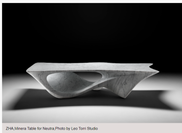
ZHA,Minera Table for Neutra

Minera 餐桌以材質和精緻工藝定義了全新獨特的系列產品，表現了自然界中明顯的侵蝕現象，這張餐桌的流線型樣貌是由Neutra專家從一塊大理石單塊上巧妙雕刻而成的。可容納最多八人用餐，更是獨家限量八件的作品。