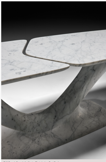
ZHA,Branch Console for Neutra,Photo by Leo Torri Studio