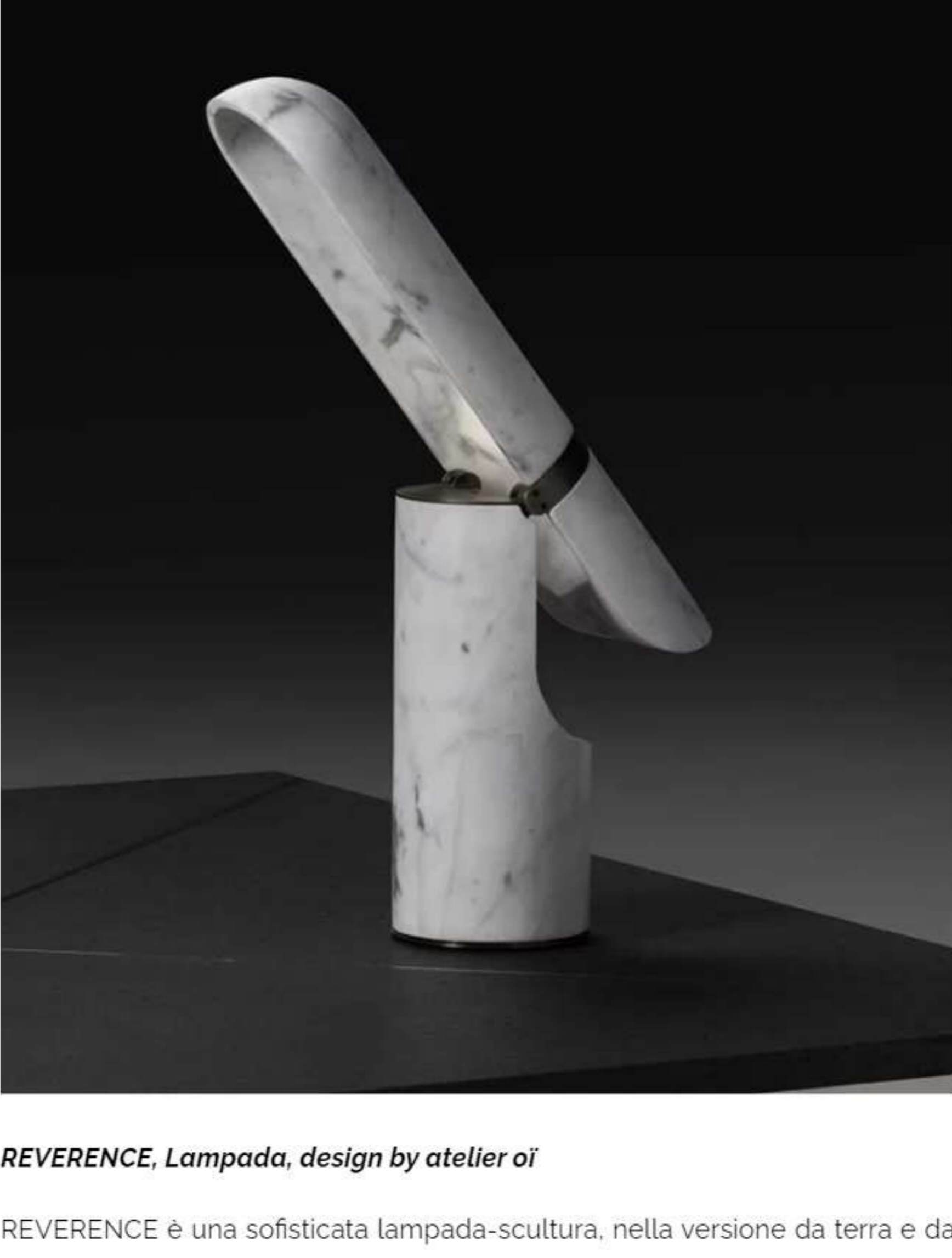
REVERENCE, Lampada, design by atelier oi