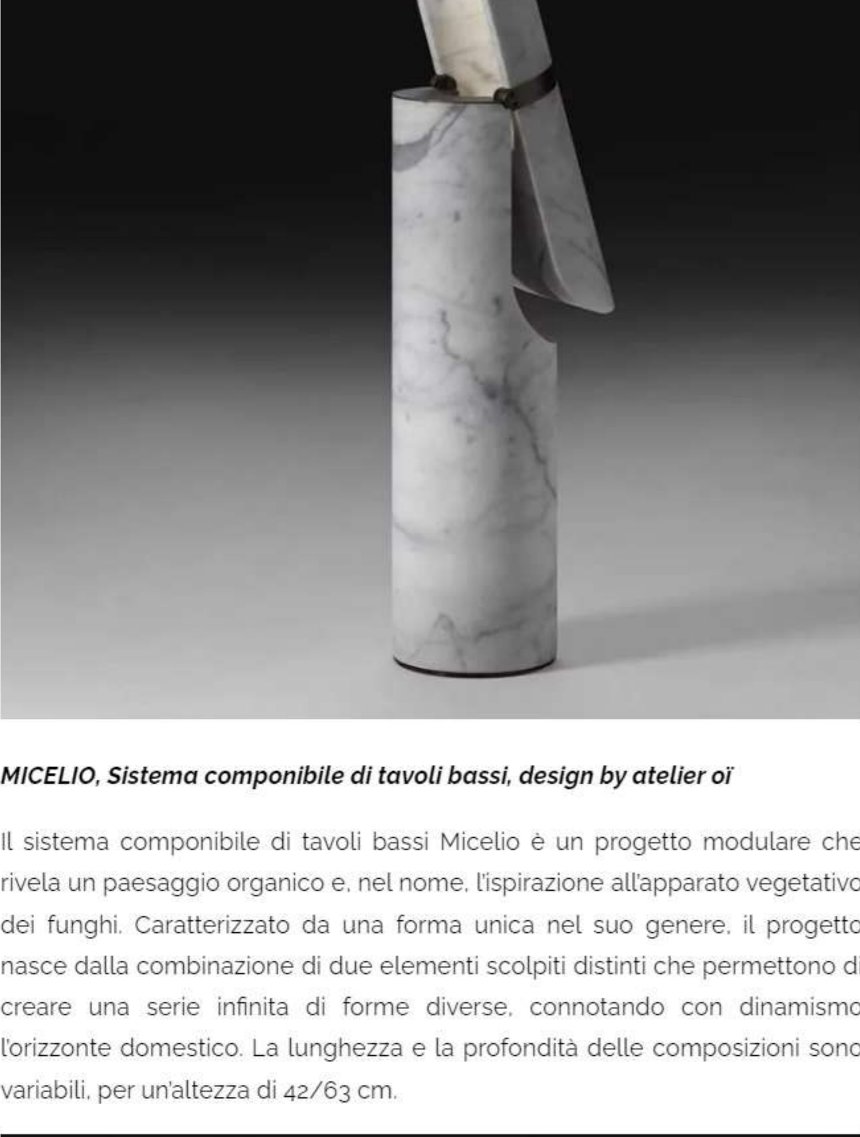
MICELIO, Sistema componibile di tavoli bassi, design by atelier oi

Il diffusore può essere orientato a piacimento consentendo una diversa distribuzione della luce, a seconda della collocazione, determinando, ancora una volta, la dualità della sua natura: oggetto scultura, quasi cristallizzato nelle sue forme scolpite nella pietra, ma anche un prodotto in continua evoluzione e movimento. Disponibile in due dimensioni (da tavolo 16x16x75 cm e da terra 24x24x145 cm), è in grado di valorizzare qualsiasi ambiente con la sua eleganza discreta e sofisticata al contempo.