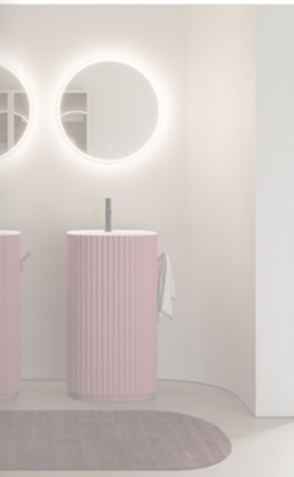
group har fått priset Red Dot -24 för kombinationen n och innovation. Formgivare är Ideagroups chefsdesigner istalplant med vertikala, dekorativa linjer. Modernt och