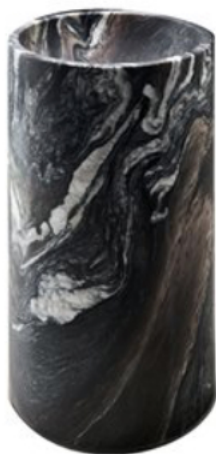
Från Neutra, en annan expert på produkter av marmor av högsta kvalitet, kommer nya tvättstället Minimal M6. Tuffa Minimal är designat av Nespoli e Novara i vackert ådrad Cipollino. Stiligt, modernt! Foto Neutra